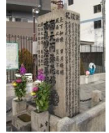
大地震両川口津浪記(大阪市浪速区)