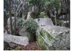
小豆島天狗岩丁場跡の残石