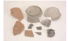
越智遺跡出土「越」などと書かれた墨書土器