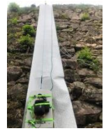
竹田城石垣の内部状況を地中レーダー(GPR)で探る。