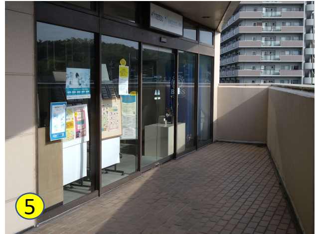
階段を上がり、そのままお進み頂き、突き当りを左に行くと入口がございます