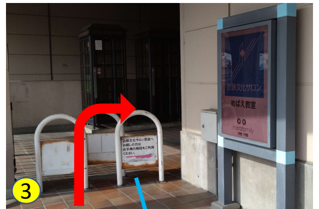
右手奥に、文化サロン2階受付へ上がる階段がございます