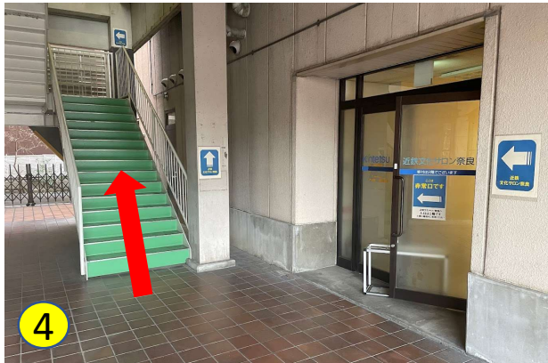
こちらの階段を2階へお上がりください