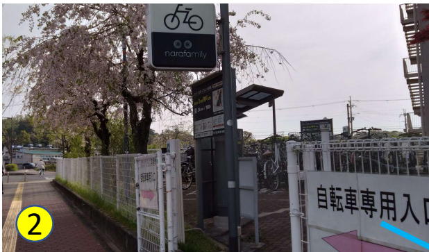
駐輪場が見えたら、右にぐるっと曲がります